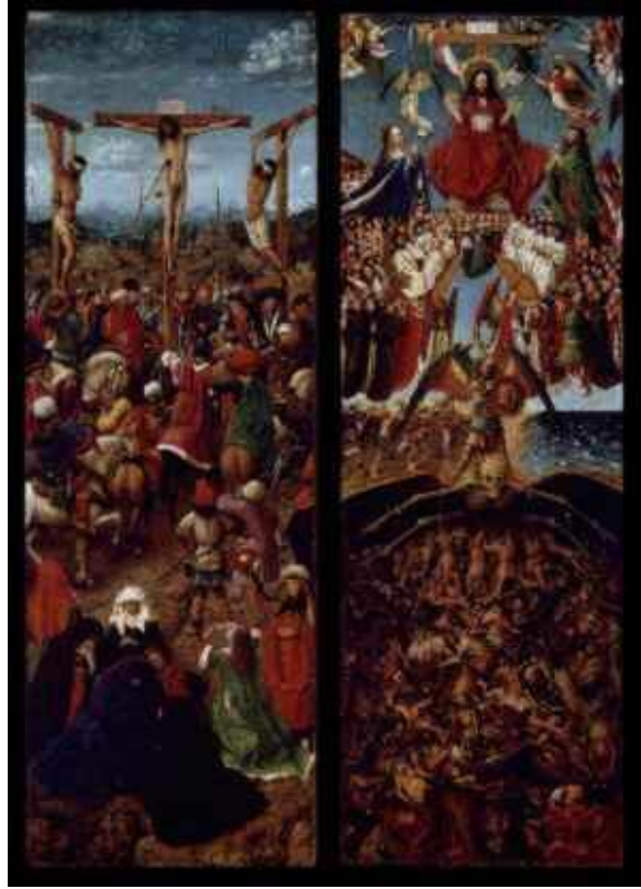
جان فان ئایک JanVan Eyck

هونه‌ری ئه‌وروپیی سه‌ده‌گانی ناوه‌پراست و پینسانس ٢٦١